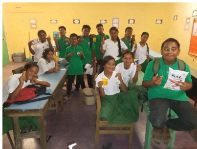
北門高中寄送台灣零食至馬紹爾共和國瓜加林環礁高中，再透過視訊交流。

校長吳俊憲表示，展現北門高中學生紮實的英語能力與文化自信，更成功地將台灣文化推向國際。