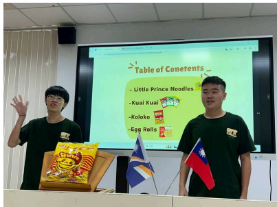
北門高中寄送台灣零食至馬紹爾共和國瓜加林環礁高中，再透過視訊交流。

北門高中與馬紹爾共和國瓜加林環礁高中（Kwajalein Atoll High School）簽署教育合作協議書，今年寄送台灣零食至該校後，再透過視訊交流，透過生活化的主題和零食分享，建立更熱絡的互動與友誼。