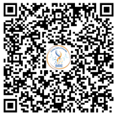
北部場次 報名請掃碼