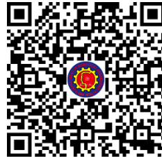
南部場次 報名請掃碼