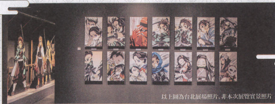
以上圖為台北展場照片，非本次展覽實景照片