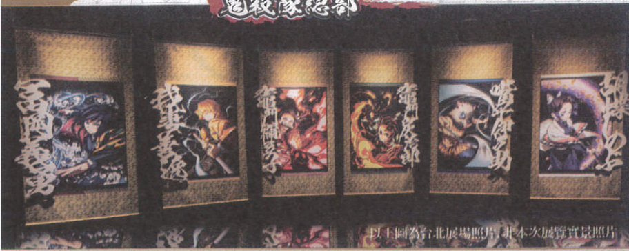
以上圖為台北展場照片，非本次展覽實景照片

▲鬼殺隊核心所在的鬼殺隊總部。這個展間集中展示著與鬼殺隊有關的展品，例如組織圖、隊員與關係人物的紀錄、日輪刀，以及隊員的名言影像集等等。可在此回顧他們踏上性命討伐鬼，守護人類的戰鬥歷史。