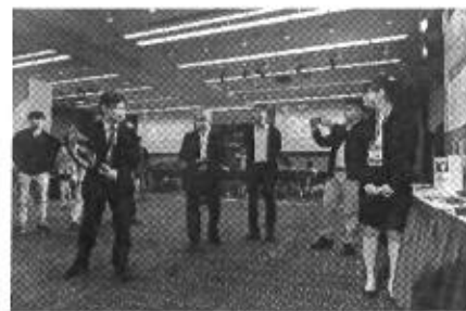
科技部次長陳宗權體驗獲獎學設計創意作品