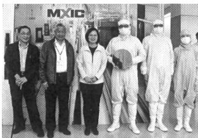
蔡英文總統親臨旺宏參觀，肯定旺宏的研發實力與成果