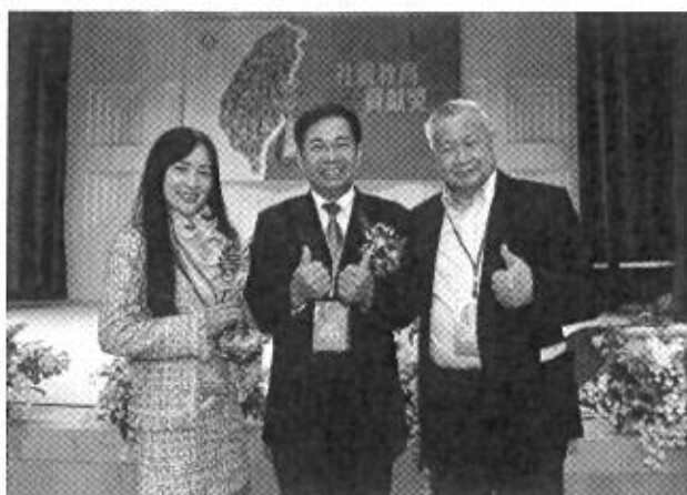
2021年基金會因長期推動國內科學教育，由教育部潘文忠部長頒授「社會教育貢獻獎」的肯定

「旺宏科學獎」強調創新，希望打造公平公正公開的競賽平臺，並透過高額獎學金制度，激發每位參賽同學的創意潛能。期許未來能持續影響年輕世代勇敢天馬行空，務實動手實踐，厚植臺灣基礎科學實力。